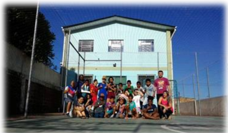
Centro Social Scalabrini